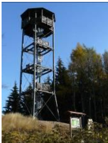
Rozhledna na markoušovickém hřebeni