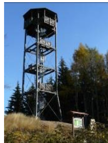
Rozhledna na markoušovickém hřebeni